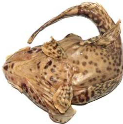
Рис. 6. P. ventrimaculata (формалин), вид снизу, 195 мм TL, 141 мм SL, Море Космонавтов Fig. 6. P. ventrimaculata (formalin), ventral view, 195 mm TL, 141 mm SL, Cosmonauts Sea

2b. Нижняя поверхность головы, грудь, живот и основания грудных плавников окрашены однотонно, без контрастных тёмных пятен; подбородочный усик (8–12 % SL) тонкий и часто двуцветный, с едва выраженным в ширину терминальным расширением или без него; вершина нижней челюсти более или менее закругленная, умеренно или слабо выдается вперед; при закрытом рте могут быть обнажены передние ряды зубов на симфизе и нижнечелюстная дыхательная перепонка . . . . . 3