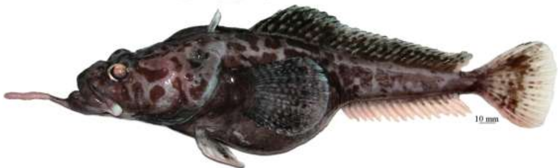
Рис. 12. P. sp. E , самка, 286 мм TL, 224 мм SL, море Амундсена Fig. 12. P. sp. E , female, 286 mm TL, 224 mm SL, Amundsen Sea