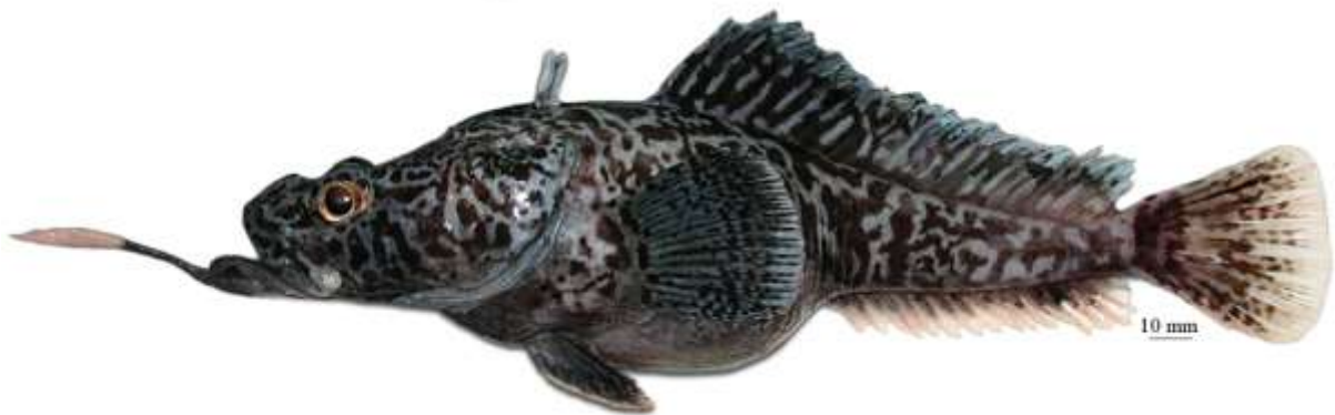
Рис. 14. P. sp. G , самец, 250 мм TL, 203 мм SL, море Амундсена Fig. 14. P. sp. G , male, 250 mm TL, 203 mm SL, Amundsen Sea