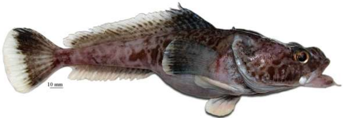
Рис. 5. P. barsukovi , самка, 270 мм TL, 222 мм SL, море Росса Fig. 5. P. barsukovi , female, 270 mm TL, 222 mm SL, Ross Sea

2a. Нижняя поверхность головы, грудь, живот и основания грудных плавников покрыты относительно крупными, контрастными тёмными пятнами; подбородочный усик (9,8–12,9 % SL) толстый и двуцветный, с крупными, контрастными темными пятнами на светлом стебле, часто довольно густо покрытом папиллами, и светлым, длинным (50–66 % длины усика), кустистым терминальным расширением, образованным длинными, тонкими, заостренными на вершине, неветвящимися и ветвящимися отрезками; вершина нижней челюсти заострена или более или менее закругленная, заметно выдается вперед; при закрытом рте обнажены все ряды зубов на симфизе и часто передний край языка; второй спинной плавник у взрослых самцов пестрый и умеренно высокий (до 22% SL), с небольшой передней лопастью. Прибрежный вид, известный с глубин 247–460 м в морях Уэдделла и Космонавтов; достигает общей длины 260 мм (214 мм SL) (рис. 6) . . . . . . . . . . пятнистобрюхая бородатка P. ventrimaculata Eakin, 1987