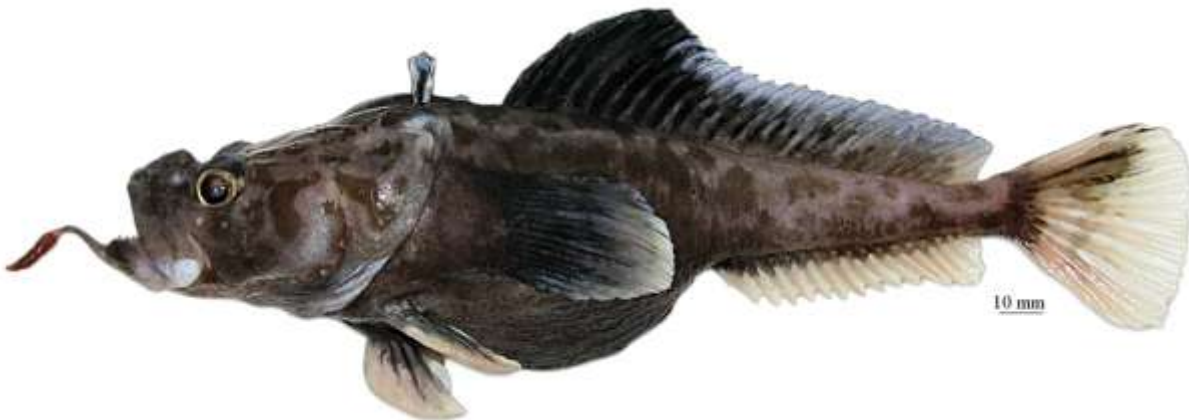
Рис. 10. P. sp. C, самец, 260 мм TL, 208 мм SL, море Росса Fig. 10. P. sp. C, male, 260 mm TL, 208 mm SL, Ross Sea

известный лишь по голотипу (самцу: 234 мм TL, 197 мм SL), пойманному на глубине 1947 м в море Беллинсгаузена . . . . . лысая бородатка P. bellingshausenensis Eakin, Eastman et Matallanas, 2008 4d. Подбородочный усик более или менее утолщенный, контрастно двуцветный, с ярко-красным (выцветающим до светлого у фиксированных рыб) терминальным расширением и темным стеблем; терминальное расширение умеренной длины (менее 50% длины усика), заметно более широкое, чем прилегающая часть стебля; общая окраска тела светло-коричневая; верх головы, затылок и спина перед первым спинным плавником покрыты четкими, преимущественно округлыми темными пятнами; второй спинной плавник у взрослых самцов черный в передней части, умеренно высокий (до 22% SL), с небольшой передней лопастью. Глубоководный вид, известный по двум экземплярам общей длиной до 300 мм (250 мм SL), пойманным на глубине 1090–1470 м в море Росса (рис. 10) . . . . . P. sp. C