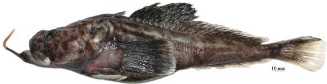
Рис. 11. P. sp. D , самец, 276 мм TL, 224 мм SL, море Амундсена Fig. 11. P. sp. D , male, 276 mm TL, 224 mm SL, Amundsen Sea

6. Подбородочный усик (20–27 % SL) со стеблем, имеющим нечеткую темную пятнистость, и оранжевым (у живых рыб) терминальным расширением, образованным простыми или иногда слабо ветвящимися, очень короткими пальцевидными отростками; темные пятна на голове, затылке и спине перед первым спинным плавником немногочисленные, средние по размеру, более или менее округлые или нечеткие; вершина нижней челюсти угловидно-заостренная и заметно выдается вперед; при закрытом рте зубы на симфизе обнажены. Прибрежный вид, известный по четырем экземплярам (самке: 203 мм TL, 164 мм SL и трем ювенильным особям: 63 мм, 92 мм и 106 мм SL), пойманном на глубине 423–666 м в море Уэдделла . . . . . оранжевоусая бородатка P. orangei Eakin et Balushkin, 1998