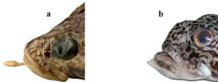
Рис. 4. Два типа формы орбиты у видов Pogonophryne . Прерывистые линии показывают передние границы орбиты и глазного яблока. а – P. marmorata (формалин); наличие антеровентрального выступа, не заполненного глазным яблоком (показано стрелками) – тип, свойственный группе “ P. marmorata ”; б – P. barsukovi ; округлый передний край орбиты с вплотную прилегающим глазным яблоком – тип, свойственный всем прочим группам видов

1b. Подбородочный усик толстый, короткий (около 10–12 % SL), светлый; булавовидное терминальное расширение заметно варьирует в длину (около 30–60 % длины усика), примерно в 2–3 раза шире прилегающей части стебля, образовано толстыми, стоячими, преимущественно продольными, узорчато-гофрированными складками; угловидный орбитальный выступ расположен в антеровентральной части орбиты; второй спинной плавник у взрослых самцов с очень высокой (до 31% SL) передней лопастью. Циркумантарктический, главным образом прибрежный вид, встречающийся на глубинах 140–1405 м; достигает общей длины 210 мм (167 мм SL) (рис. 4а) . . . . . ..... мраморная бородатка P. marmorata Norman, 1938