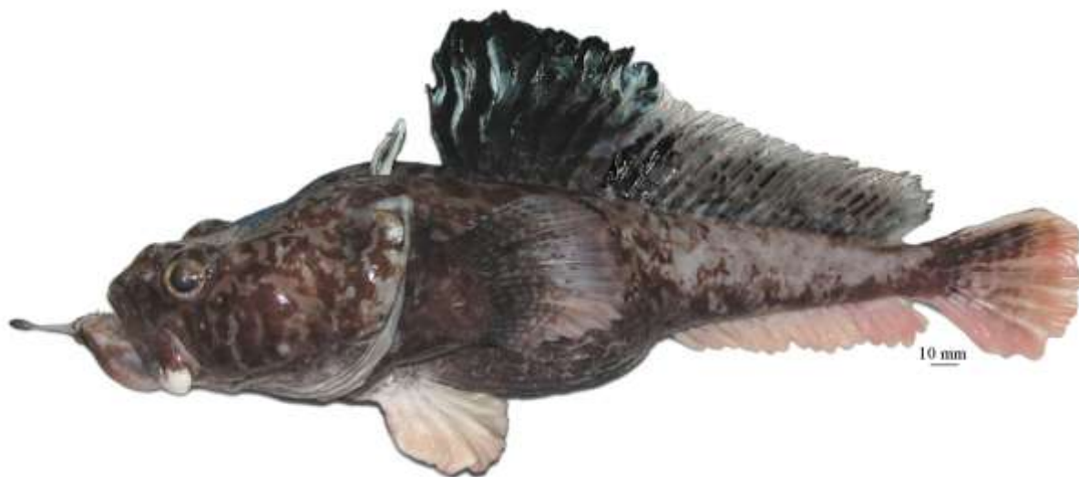
Рис. 8. P. neyelovi , голотип (МПХНУ Р299), самец, 355 мм TL, 295 мм SL, море Росса Fig. 8. P. neyelovi , holotype (MNKhNU R299), male, 355 mm TL, 295 mm SL, Ross Sea

налегающими друг на друга чешуевидными придатками с фестончатыми верхними краями; общая окраска тела светлая; верх головы, затылок и спина перед первым спинным плавником покрыты четкими, главным образом округлыми темными пятнами. Прибрежный вид, известный лишь по голотипу (молодому самцу, 147 мм SL), пойманному на глубине 651–742 м у Земли Королевы Мод (Индоокеанский сектор) . . . . чешуйчатая бородатка P. squamibarbata Eakin et Balushkin, 2000