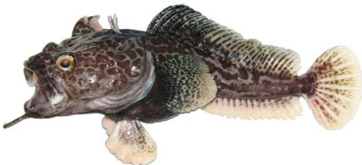
Рис. 9. P. tronio , голотип (МПХНУ Р295), самец, 290 мм TL, 234 мм SL, море Росса Fig. 9. P. tronio , holotype (MNKhNU R295), male, 290 mm TL, 234 mm SL, Ross Sea

4с. Подбородочный усик (13% SL) тонкий, двуцветный, с кремовым (у фиксированных рыб) терминальным расширением и светлым стеблем, покрытым в базальной половине темными пятнами; терминальное расширение закругленное на конце, очень короткое (около 16% длины усика), слабо выраженное, едва шире прилегающей части стебля, образованное короткими пальцевидными отростками; общая окраска тела светлая; верх головы покрыт четкими, преимущественно округлыми темными пятнами; затылок и спина перед первым спинным плавником без пятен; второй спинной плавник у самцов пестрый, очень низкий (около 14% SL), без передней лопасти. Глубоководный вид,