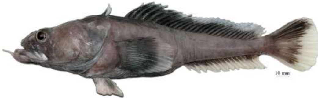
Рис. 1. P. immaculata , самка, 250 мм TL, 202 мм SL, море Росса Fig. 1. P. immaculata , female, 250 mm TL, 202 mm SL, Ross Sea

2a. Подбородочный усик, если имеется, очень короткий (2–9 % SL), белого цвета, притупленный на кончике; общая окраска тела у живых рыб однотонно-сероватая или слегка коричневатая с розоватым оттенком; плавники отчетливо двуцветные: темные или черноватые у основания и светлые или белые у внешнего края; верхний профиль головы выпуклый; голова у посттемпоральных гребней относительно высокая (не менее 20% SL); в срединной боковой линии 12–29 (обычно 16–29) пор; второй спинной плавник у взрослых самцов с высокой (23–27 % SL) черной передней лопастью. Глубоководный вид, известный с глубин 800–2542 м от Южных Оркнейских островов и из моря Росса; достигает общей длины 268 мм (209 мм SL) (рис. 1) ..... ..... непятнистая бородатка P. immaculata Eakin, 1981