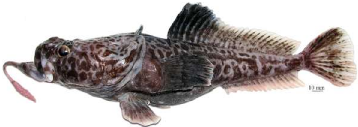
Рис. 13. P. sp. F , самец, 324 мм TL, 257 мм SL, море Росса Fig. 13. P. sp. F , male, 324 mm TL, 257 mm SL, Ross Sea