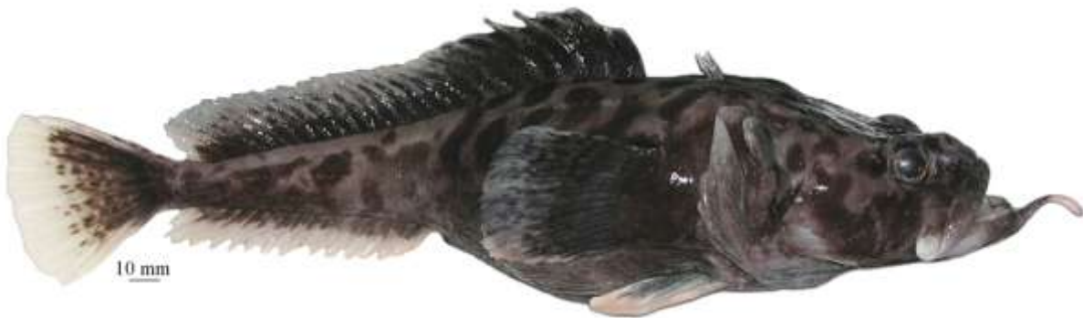
Рис. 7. P. brevibarbata , самка (МПХНУ Р298), 325 мм TL, 262 мм SL, море Росса Fig. 7. P. brevibarbata , female (MNKХNU R298), 325 mm TL, 262 mm SL, Ross Sea

..... хмелеусая бородатка P. neyelovi Shandikov et Eakin, 2013