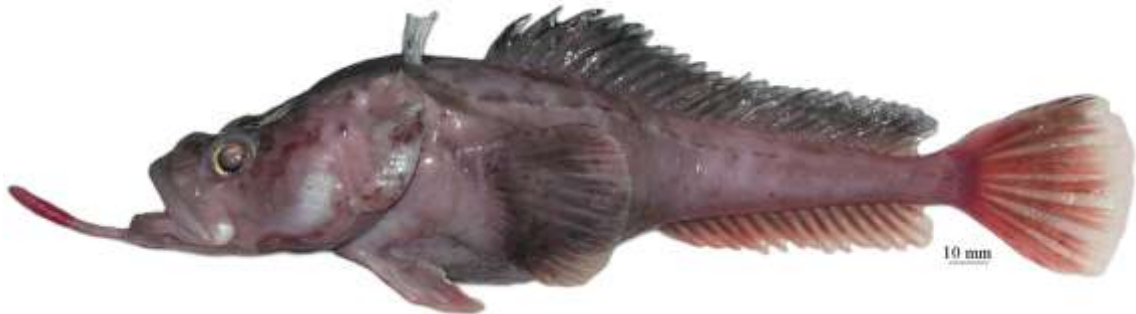
Рис. 2. P. sp. A , самка, 252 мм TL, 200 мм SL, море Амундсена Fig. 2. P. sp. A , female, 252 mm TL, 200 mm SL, Amundsen Sea

общая окраска тела у живых рыб розовая, вокруг пор сейсмодатчиков головы едва видны нечеткие более темные участки. Глубоководный вид, известный по единственной взрослой самке общей длиной 252 мм (200 мм SL), пойманной на глубине около 1000 м в море Амундсена (рис. 2) . . . ..... P. sp. A